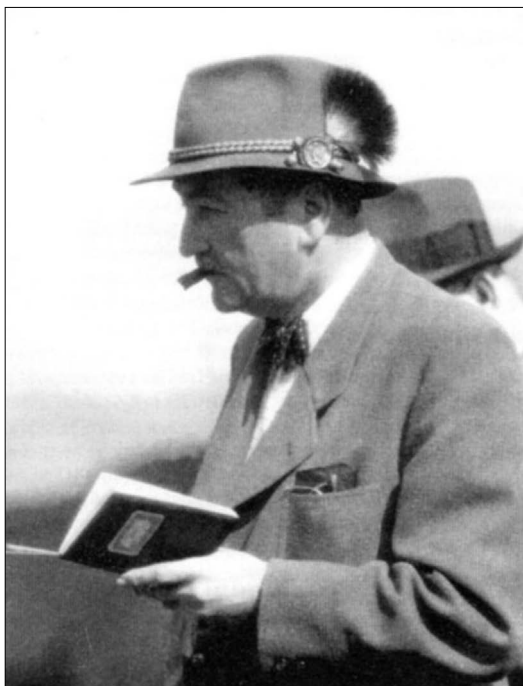
Otec typicky s doutníkem při jednom popisování a hodnocení hřřbat

Od věků do věků když otec opravdu něco umí, imponuje dítěti ve středním školním věku, tj. v době, kdy se tvoří identita podle pohlavní příslušnosti, tedy v našem případě „mužská“. A kterýpak otec se nechce před vlastními dětmi také tak trochu (či spíše více než trochu) vytáhnout. Pak je synovi i velkým vzorem – a má svého kluka na své straně. Škoda, že tuhle poučku nelze tak univerzálně rozšířit a učinit natolik srozumitelnou, aby ji přijali i dnešní otcové. Bylo by u nás méně mužských slabochů a méně nešťastných otců.